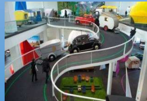
Erwin-Hymer-Museum Bad Waldsee