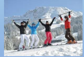
Skifahren im Allgäu