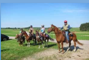
Ponyhof Eberhart Geigelbach