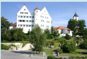
Schloss Aulendorf mit Spielzeugmuseum