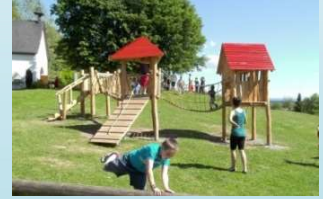
Spielplatz am Zentrum