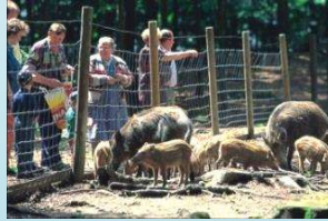
Wildgehege Tannenbühl, mit Kletterpark