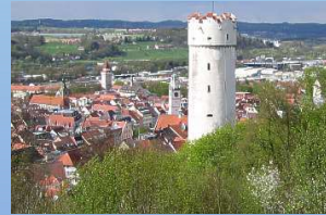
Histor. Altstadt Ravensburg