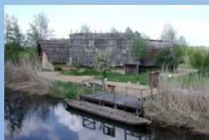
Federseemuseum Bad Buchau