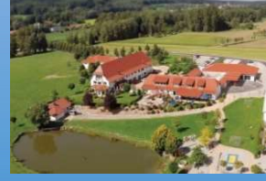
Restaurant Tiergarten Aulendorf